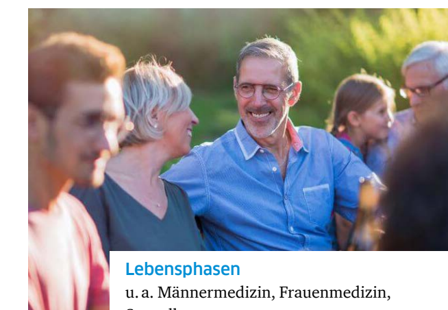
Lebensphasen u. a. Männermedizin, Frauenmedizin, Sexualhormone