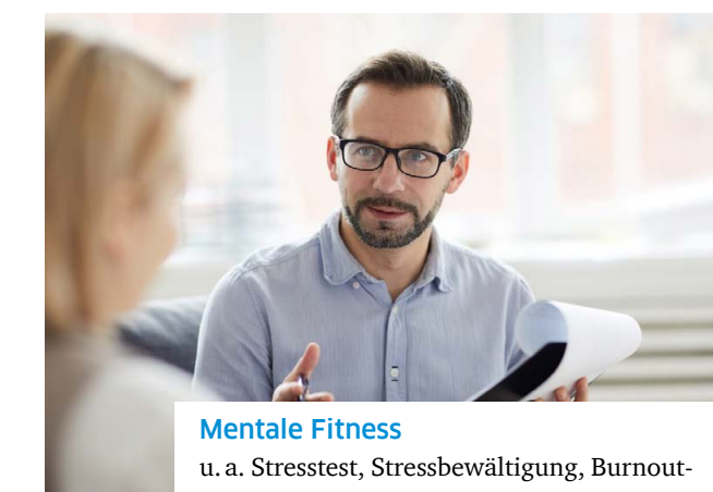
Mentale Fitness u. a. Stresstest, Stressbewältigung, Burnoutprävention