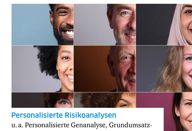
Personalisierte Risikoanalysen u. a. Personalisierte Genanalyse, Grundumsatzmessung, Bewegung