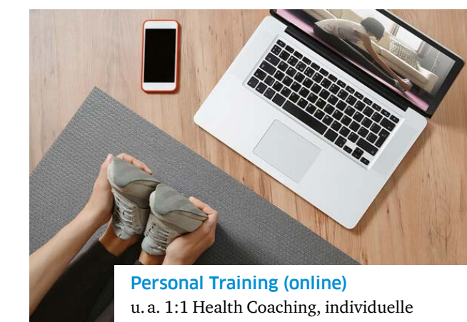
Personal Training (online) u. a. 1:1 Health Coaching, individuelle Trainingspläne, Ernährungsberatung